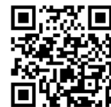
京あんしん 予約システム