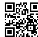
京都市新型コロナ ワクチン接種 ポータルサイト